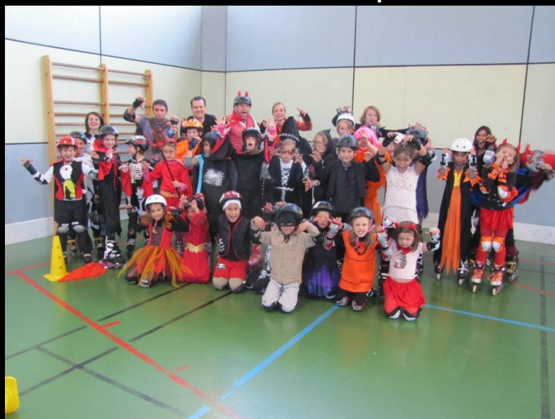
Nos petits anges se transforment en petits monstres ! Juste le temps d'une session Halloween !